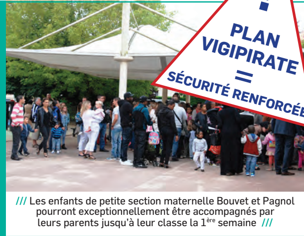
/// Les enfants de petite section maternelle Bouvet et Pagnol pourront exceptionnellement être accompagnés par leurs parents jusqu'à leur classe la 1 ère semaine ///

La menace terroriste toujours présente sur notre territoire nous impose un contrôle renforcé à l'entrée des écoles. Les consignes de l'État sont très strictes et les parents doivent rester à la grille pour déposer et récupérer leurs enfants. Cependant, à titre exceptionnel et pour permettre aux plus petits qui découvrent l'école pour la 1 ère fois, les parents seront autorisés à les accompagner jusqu'à la classe pendant la 1 ère semaine de classe uniquement.