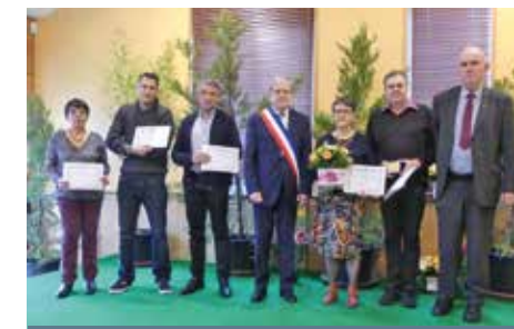
Les médaillés du travail