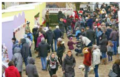
Les promenades en poney ont fait le bonheur des plus jeunes.

Bijoux, tricots faits mains, cartes et figurines de Noël, miel, chocolats et pâtisseries maison, parfums et savons... 21 exposants avaient envahi la place de l'Eglise Saint-Germain pour proposer de nombreux produits du terroir et objets de décoration, qui viendront sublimer les fêtes de fin d'année.