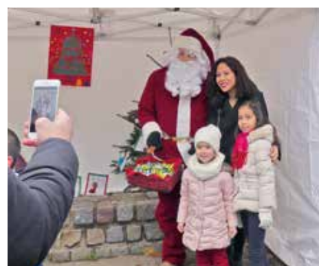
... Tout comme la distribution de confiseries et la séance-photo individuelle avec le Père Noël !