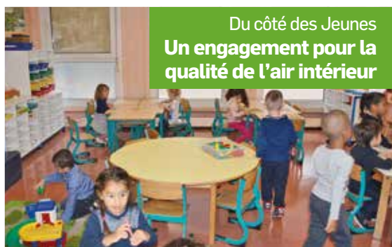
Du côté des Jeunes Un engagement pour la qualité de l'air intérieur