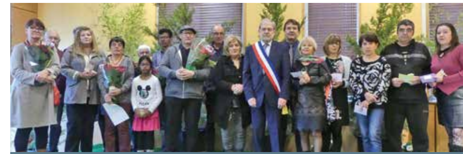
Les lauréats du concours de fleurissement