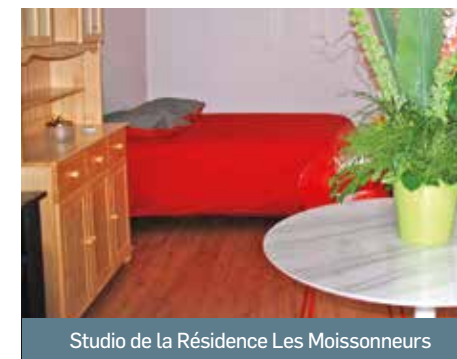
Studio de la Résidence Les Moissonneurs

La Ville propose une offre de logement pour les personnes autonomes de plus de 60 ans au sein de sa résidence-autonomie « Les Moissonneurs ». Dans un environnement calme et verdoyant, la résidence compte 80 studios de 36 m 2 , qui accueillent des locataires seuls ou en couples. Chaque appartement, entièrement équipé, est doté d'un séjour