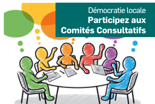
Démocratie locale Participez aux Comités Consultatifs