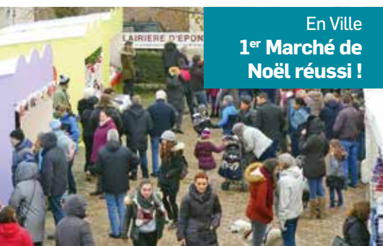
En Ville 1 er Marché de Noël réussi !

Investir sur les richesses humaines en Mairie pour mieux servir les habitants