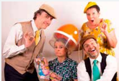
(© Charlotte Spillemaecker)

Pour sa 21 e édition, le théâtre Alphonse Daudet vous propose une programmation toujours riche et diversifiée à partager en famille. Il y en a pour toutes les générations et tous les goûts : théâtre classique ou contemporain, humour burlesque, cirque, musique de jazz ou concerto, danse néoclassique-moderne et aussi spectacles rythmés et plein d'humour pour les plus jeunes, dans l'objectif de promouvoir la culture dans toute sa diversité. Le tout à des prix très attractifs pour favoriser l'accès à la culture pour tous avec une formule d'abonnement permettant l'entrée à partir de 13 €. Les réservations sont ouvertes : il est temps de choisir les spectacles de votre année, juste à côté de chez vous. Ce sont près de 450 abonnés de Coignières et d'ailleurs qui font confiance chaque année à la programmation de François Guillon, directeur du théâtre.