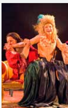
(© Christophe Vootz)