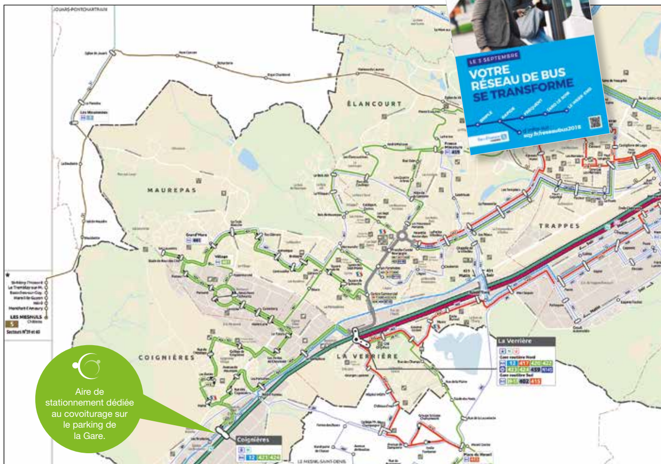
Plan du secteur Ouest et nouveau maillage de votre réseau de bus. Plus d'information sur : sqy.fr/reseabus2018 ou www.saint-quentin-en-yvelines.fr . Mises en service et nouveaux horaires sur : Yvelines SQYBUS – Tél. : 0800 200 476 – www.sqybus.fr .