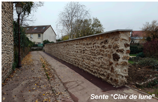
Sente "Clair de lune"