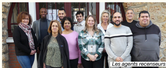
Les agents recenseurs