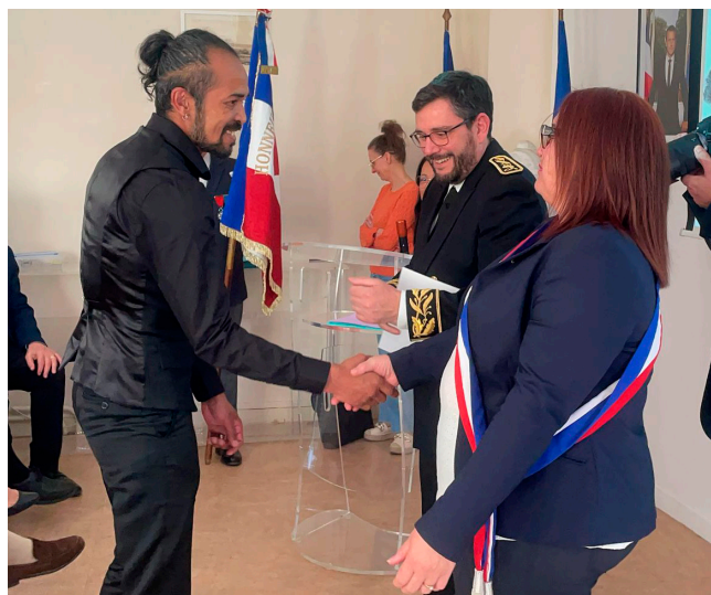
Cérémonie de naturalisation 2025

Par ce suivi social et administratif, le CCAS se positionne comme un acteur de proximité et d'écoute, au service de tous les habitants, contribuant au maintien du lien social.